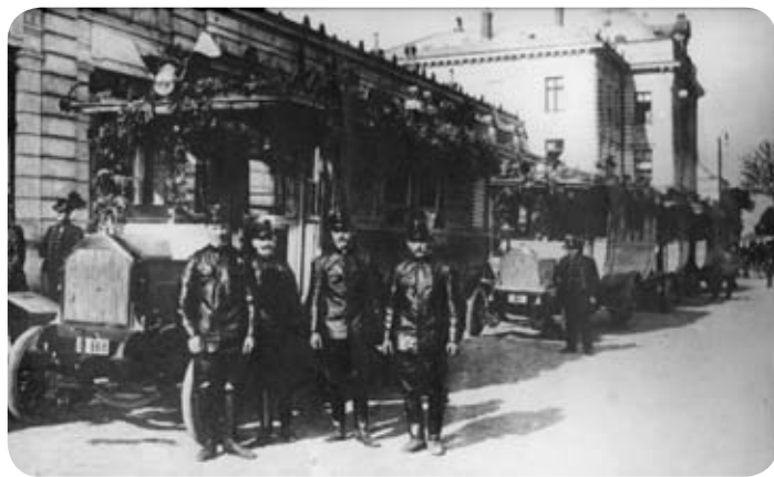
Autobusy u pardubického nádraží před zahajovací slavnostní jízdou 13. 5. 1908.