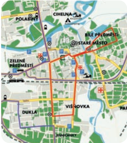
— Ohláškové trasy - komunikace bez omezení dopravy — Trasa Půlmaratonu - újinná svazková komunikace

V sobotu 19. dubna se již od půl desáté promění třída Míru v centrum zábavy a sportu. Koná se zde již druhý ročník Pardubického vinařského půlmaratonu. Akce sice přinese občanům jistá omezení v dopravě, jak je patrné z přiložené mapky, ale odměnou jim bude nevěšdní zážitek.