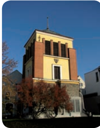
Pardubická zvonice. Její podobu z roku 1892 můžete vidět na str. 7.

u farního kostela sv. Bartoloměje z původních tří zvonů jediný – Bartoloměj, vyrobený v roce 1653 zvonařskou dílnou Martina Schrötera z Hostinného.