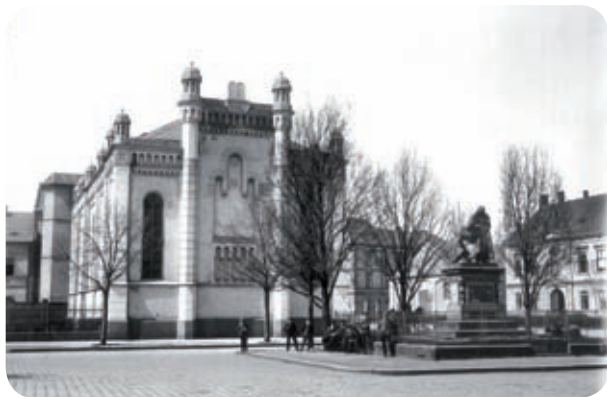
Pomník bratranců Veverkových v Pardubicích před synagogou (počátek 20. stol.,)