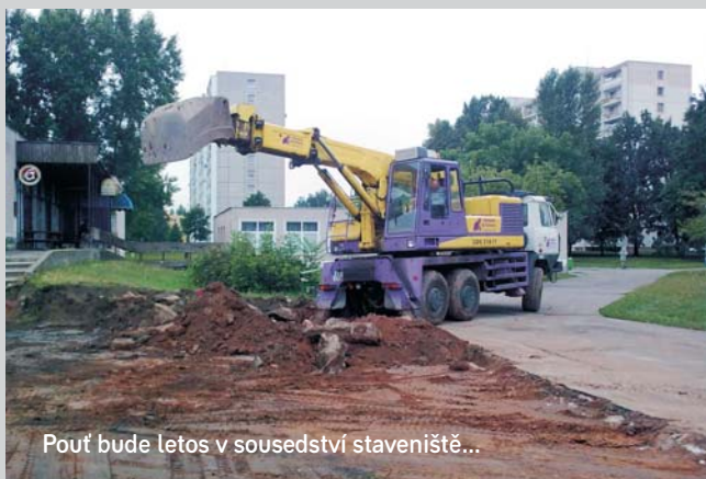
Pouť bude letos v sousedství staveniště...

ních let a vítězná cena firmy Chládek a Tintěra Pardubice a.s. je na polovině rozpočtových nákladů. Díky tomu rada rozhodla i o realizaci druhé etapy, která bude prozatím závěrečná. Oproti původnímu velkorysému záměru došlo k určitým změnám s cílem snížit celkové náklady a současně minimalizovat radikální změny v prostoru louky pod duby. Tím reagujeme i na některé připomínky občanů k původnímu projektu, v nichž zazněly obavy z narušení zeleně v této části sídliště. V tomto prostoru tedy nebudou měněny trasy chodníků, pouze budou stávající chodníky opatřeny novým krytem z betonové dlažby navazující na řešení první etapy. Současně bude kompletně rekonstruováno veřejné osvětlení a vyměněny lavičky.