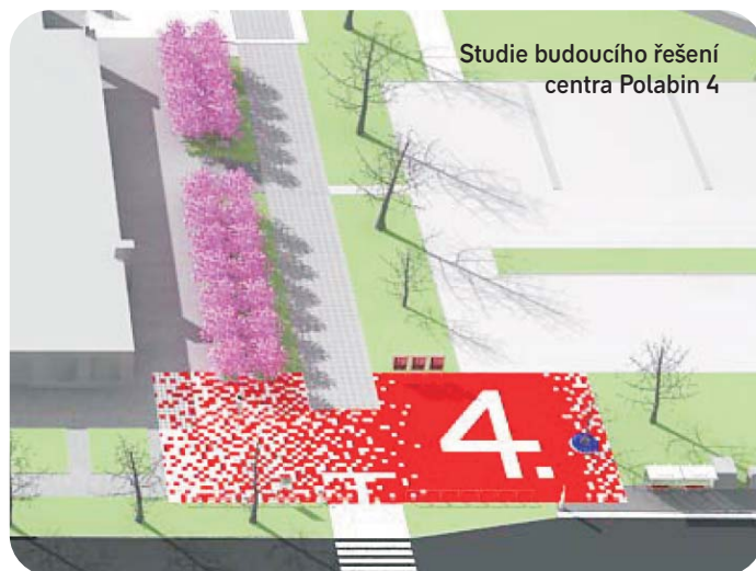
Studie budoucího řešení centra Polabin 4