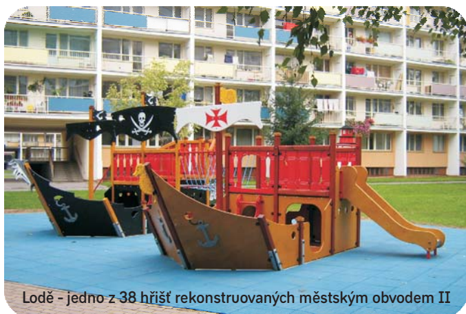
Lodě - jedno z 38 hřišť rekonstruovaných městským obvodem II

Jedno úskalí je ještě skryto ve formulaci otázky do referenda. Běžné je ptát se občanů, zda souhlasí s nějakou zásadní změnou. Pardubičtí zastupitelé se však rozhodli pro poněkud neobvyklý dotaz na současný stav. Takže pozor, v referendu 13. 6. 2013 neplatí, že když zůstanete doma, zůstane vše při starém, nýbrž mohou nastat velké změny. Tak nezůstávejte doma a přijďte hlasovat. Když už bylo referendum vyhlášeno, má smysl se ho zúčastnit a vyslovit svůj názor.