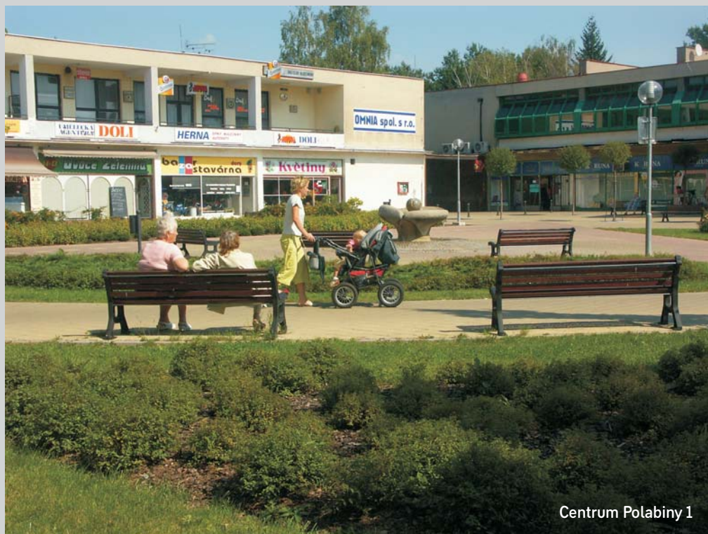
Centrum Polabiny 1

pravovaným akcím získáte na www.pardubice2.cz .