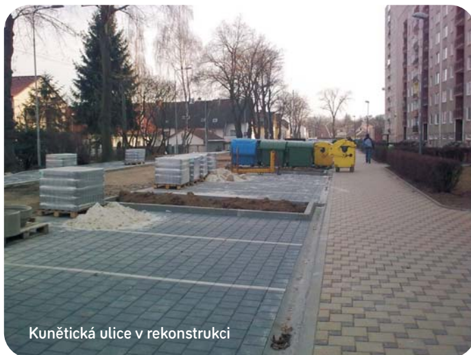
Kunětická ulice v rekonstrukci