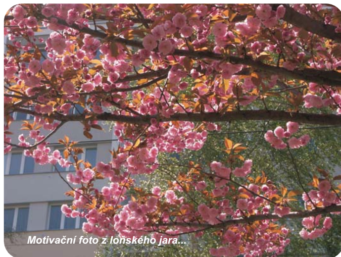
Motivační foto z loňského jara...