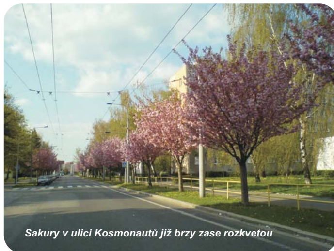
Sakury v ulici Kosmonautů již brzy zase rozkvetou