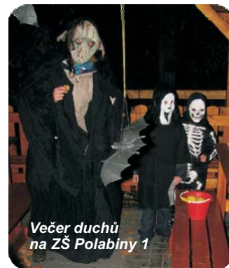
Večer duchů na ZŠ Polabiny 1

Na konci roku si nenechte ujít ohňostroj na rozloučení s kalendářním rokem, který se letos koná 22. 12. od 17.00 na nádvoří školy. Radek Hejný, ředitel školy