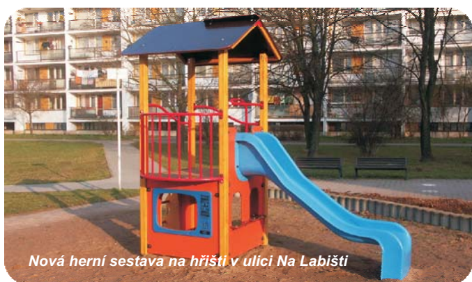
Nová herní sestava na hřišti v ulici Na Labišti

● V rámci postupného naplňování jednoho z cílů Programu rozvoje MO Pardubice II se letos dočkají nového přístřešku kontejnerů na odpad v ulici Grusově, které dosud stojí volně na parkovišti. ● U asfaltového hřiště v ulici Ohrazenické budou vybudovány masivnější zábrany chránící zaparkovaná vozidla a nedaleký dům před letícími míči. ● Jako každé dva roky letos proběhne výměna písku ve všech pískovištích v MO Pardubice II ●