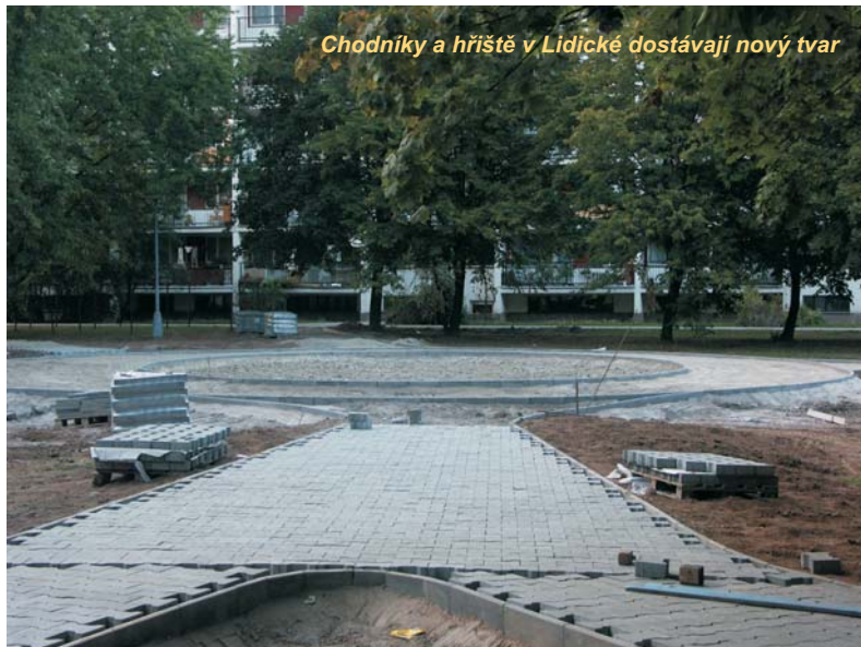
Chodníky a hřiště v Lidické dostávají nový tvar