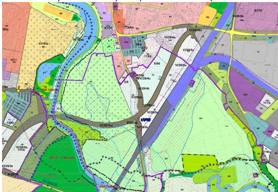
Obrázek č 3 – výřez z koordinačního výkresu varianty č. 1 návrhu XIX. změny ÚPmP