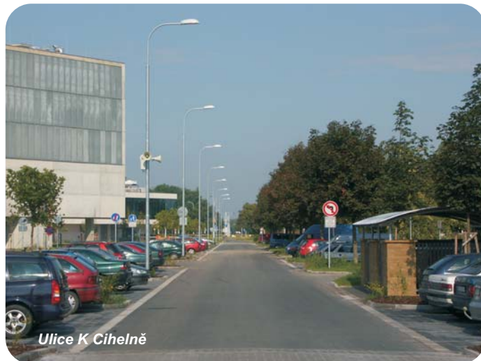
Ulice K Cihelně