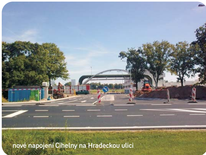
nové napojení Cihelny na Hradeckou ulici