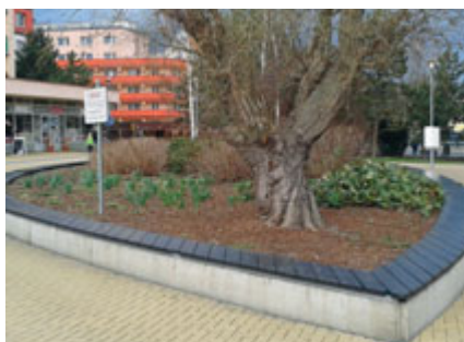
Záhony v ulici Jiřího z Poděbrad

Kromě čerstvě mulčem doplněných záhonů nám velkou radost dělají také další záhony, o něž se pravidelně staráme v průběhu celého roku, a které se nám za naši péči odvděčují pestrou paletou barev, tvarů a vůní.