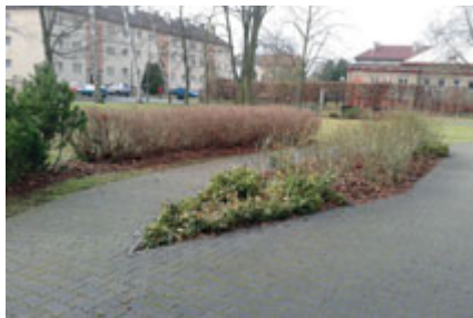
Parčík u MŠ Kamínek (Ke Kamenci)

kúra tak provoněla zejména záhony na Dašické, nám. Legií, záhony Arnošta z Pardubic, záhon před ZŠ Závodu míru, živý plot ve Winterově ulici, záhony Karla IV., Čechovo nábřeží u Katastrálního úřadu a zbývají dokončit ještě vyvýšené záhony v ulici Hronovická.