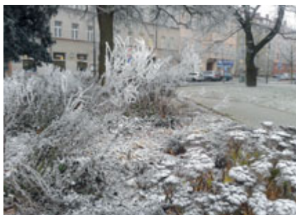
Náměstí Čs. legií

Ačkoliv se za našimi okny už o slovo pomalu hlásí první jarní květiny a benjamínky ročních období pomalu přebírá svoji vládu, letošní zima si pro bystrého a všímavého Pardubáka připravila dlouho v našich podmínkách nevídané a nezapomenutelné obrazy. Na ponechaných uschlých květenstvích okrasných keřů, trvalek a travin rozehrála berla Mrazilka opravdu jedinečný a dechberoucí koncert sněžných pavučin a ostrých ledových krystalků bělavé námrazy. Takřka všude to vypadalo jako v pohádce. Za připomenutí stojí například scenérie z náměstí Čs. legií, kde se ledová krása odrážela na pozadí pečlivě udržovaného tisového živého plotu, nebo z vnitrobloku K Polabinám či ze záhonů Arnošta z Pardubic.