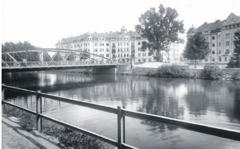
Pohled na nově postavené domy za Chrudimkou na Čechově nábřeží. Fotografie z doby kolem 1925.

Dva předchozí díly Toulky jsme vyprávěli o událostech prvních poválečných let za samostatné Československé republiky v Pardubicích. Probírali jsme onu dobu z různých úhlů pohledu. Budeme v tom pokračovat i dnes a přístě náš seriál zakončíme.