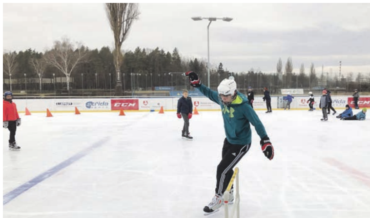
Po celý únor na ledové ploše Zimního sportovního parku soupeřily týmy pardubických základních škol v bruslařském víceboji. V prvním ročníku soutěže zvítězili žáci ZŠ Benešova a ZŠ Štefánikova.