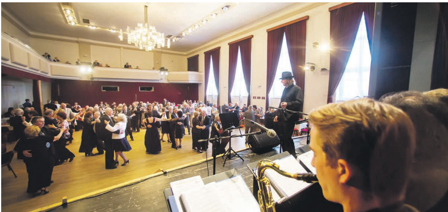
Pardubičtí senioři si v únoru opět naplno užívali svůj ples v Kulturním domě Hronovická. K tanci a poslechu hrál jako tradičně swingový orchestr JK Band, nechyběl fotokoutek ani další lákadla připravená pardubickou radnicí. Skvělou zprávou je, že lístky byly téměř ihned vyprodány a na parketu bylo hned od prvního tónu úplně plno.