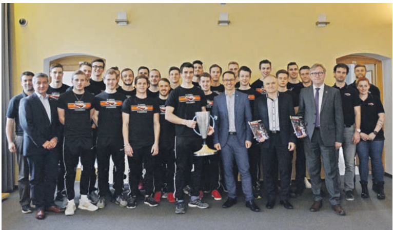
Pardubický florbal slaví v historii klubu zatím největší úspěch. Ve finále Poháru České pojišťovny porazil FBC Liberec a odvezl si jeden ze dvou nejvyšších titulů, které lze v rámci ČR získat. Gratulujeme!