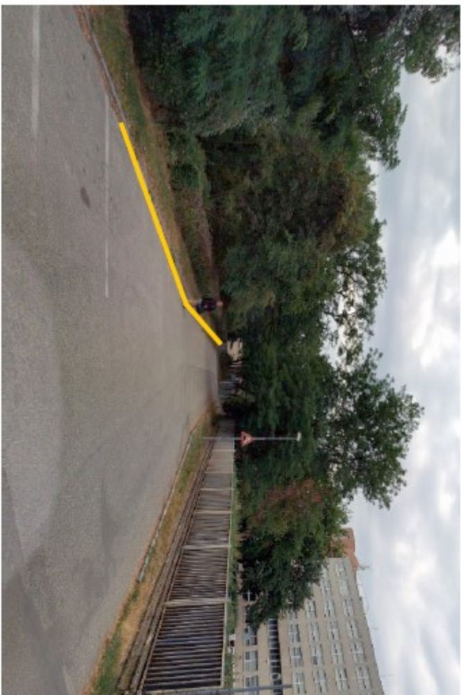
1) Stanovení vzd. V 12c v délce cca 40 m